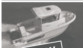
Merry Fisher 605 marlin